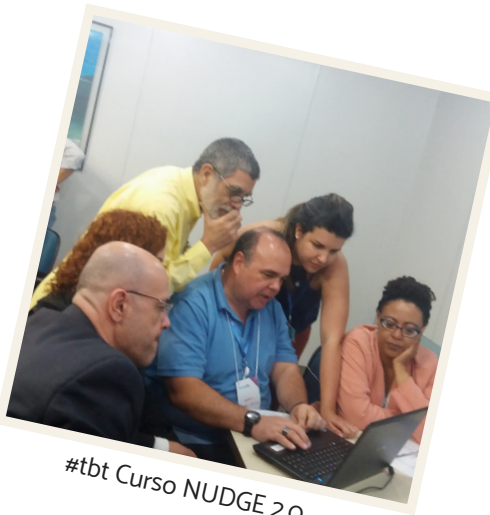
#tbt Curso NUDGE 2.0