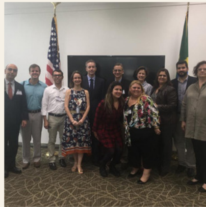
#tbt Encontro LC's e o Cônsul dos EUA