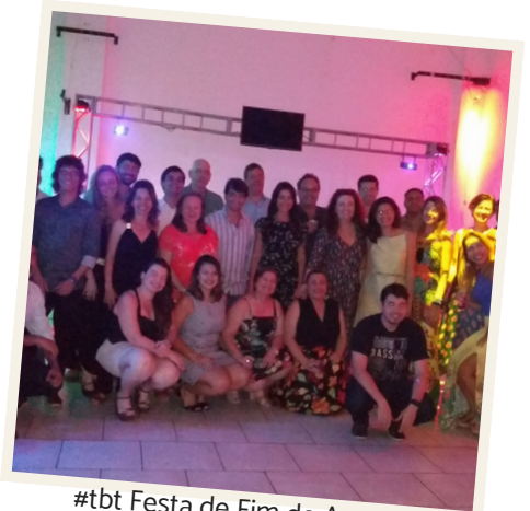
#tbt Festa de Fim de Ano dos Líderes Cariocas