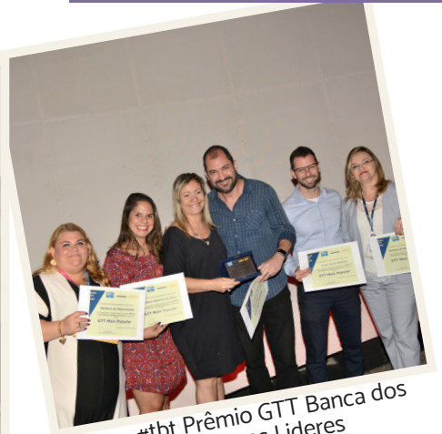
#tbt Prêmio GTT Banca dos Novos Líderes