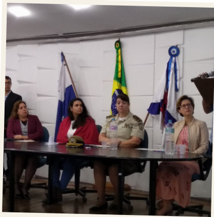
#tbt Circuito de palestras pelo Dia do Servidor promovido pela FIG