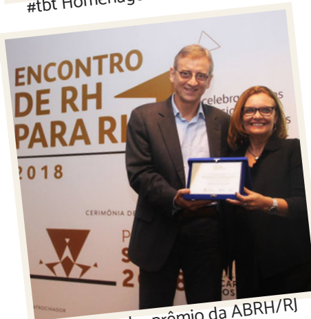
#tbt FIG recebe prêmio da ABRH/RJ pelo Programa Líderes Cariocas