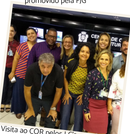
#tbt Visita ao COR pelos LC's