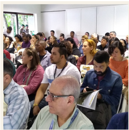
#tbt WELL da SUBMA