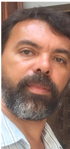
Por Vinicius Oliveira