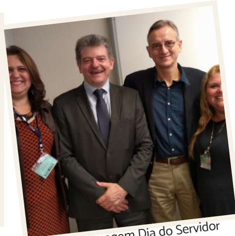
#tbt Homenagem Dia do Servidor