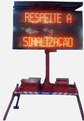
26 Painéis de Mensagens Variáveis