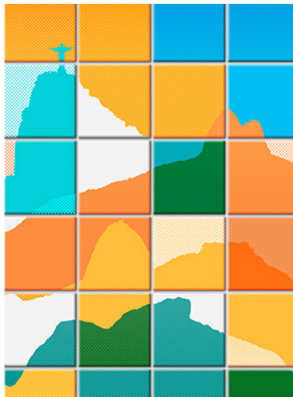
2º CONCURSO RIO EM CARTAZ

→ JUSTIFICATIVA: o trabalho se destaca pela leitura dinâmica dos elementos da paisagem, construindo o grafismo dos relevos e a geometria dos azulejos. Apresenta um interessante equilíbrio entre opacidade e transparência e uma palheta tropical de cores.