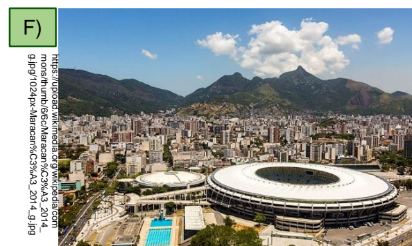
Estádio do Maracanã