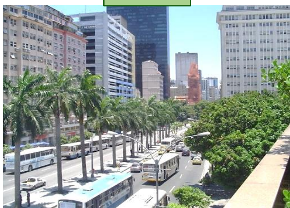
Avenida Presidente Antônio Carlos, centro do Rio de Janeiro, RJ.