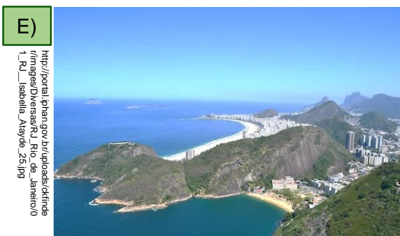
Paisagens cariocas entre a montanha e o mar