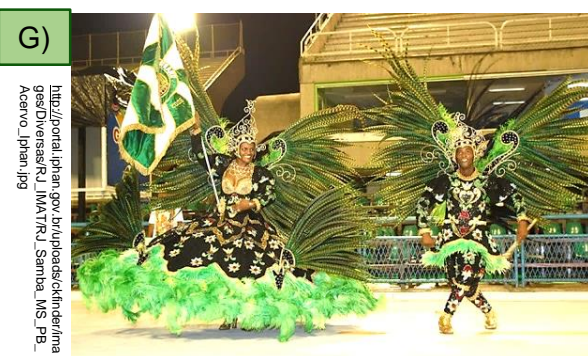
Matrizes do samba no Rio de Janeiro