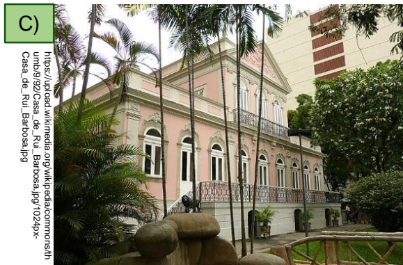
Casa de Rui Barbosa