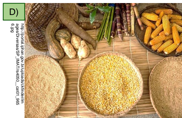
Agricultura tradicional das comunidades quilombolas