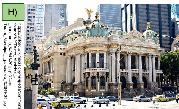
Theatro Municipal do Rio de Janeiro