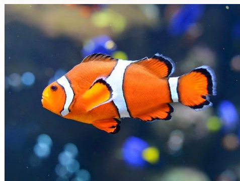
Peixe Palhaço (Nemo)

Após tentar lembrar dos 7 animais acesse o link abaixo e descubra muitos outros