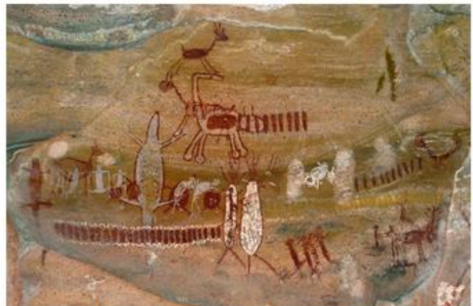
Pinturas rupestres no Parque Nacional da Serra da Capivara, Brasil.

Descreva o que você entendeu da cena que está representada na pintura rupestre.