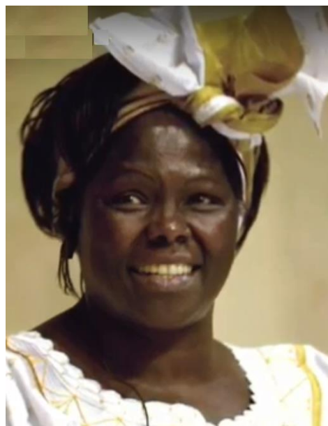
Wangari Maathai. Queniana. Primeira mulher africana a receber o prêmio Nobel da Paz em 2004.